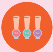
アロマハンドマッサージ ネイル

様々な肌トラブルでお困りの方からのご相談や眉の書き方などをレクチャーしています！