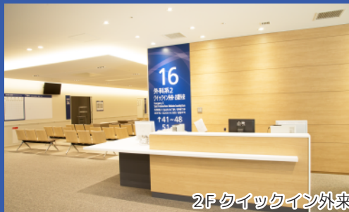
2F クイックイン外来