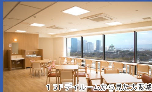
13F デイルームから見た大阪城